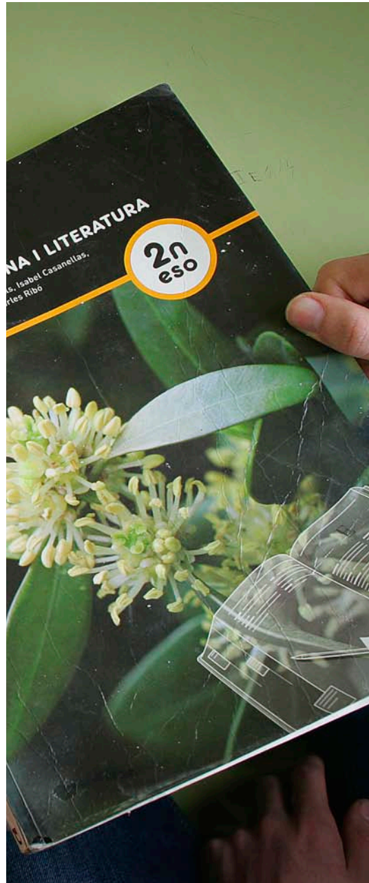
fan tres assignatures en català.

i el sociòleg, de Penya-roja de Tastavins. “Hem vingut a fer un reportatge sobre el lapao”. Fa cara d’estranyesa. “De què?”, demana. “De la nova llei de llengües de l’Aragó que diu que vostès parlen lapao”. “Aquí parlem xapurreau... o fragatí, a Fraga; mequinensa, a Mequinensa...”.